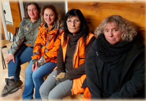
Domaine de Serre Gros

Un grand MERCI à tous les organisateurs pour ces invitations aux journées de chasses dans de magnifiques territoires avec de beaux accueils très chaleureux.