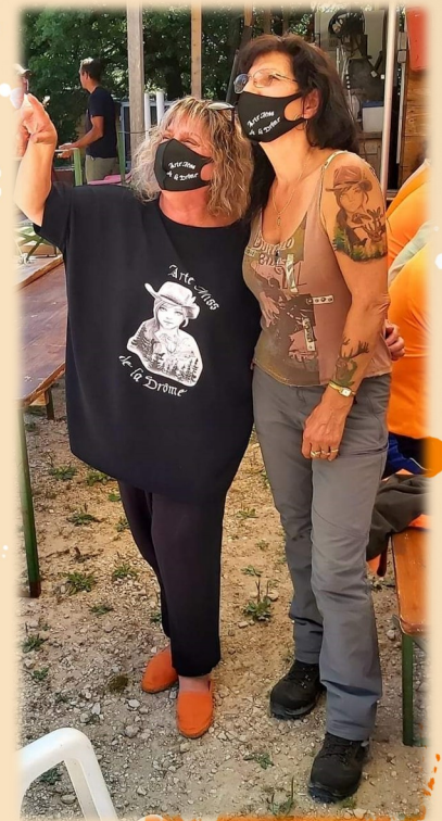
Domaine de Serre Gros à Poët-Laval

ARMURERIE ALAIN MACAIRE ARMURIER - ARQUEBUSIER 7 Ave. des allobroges 26100 ROMANS TEL : 04.75.02.15.72